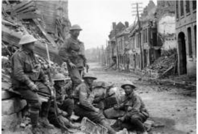
Poste d'artillerie établi par le 54 e bataillon australien durant son attaque des forces allemandes à Péronne, en septembre 1918

La bataille d'Amiens débute le 8 août 1918 par une attaque de plus de 10 divisions australiennes, canadiennes, britanniques et françaises avec plus de 500 chars. L'effet de surprise est total et sème la confusion dans les lignes allemandes, qui reculent de 24 kilomètres au sud de la Somme.