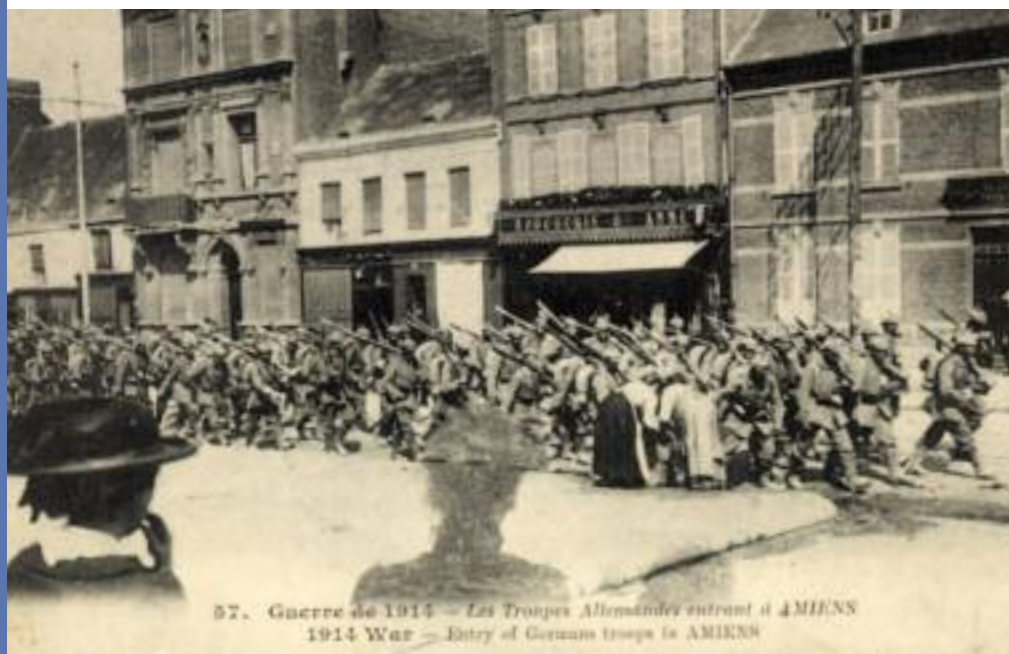
57. Guerre de 1914 - Les Troupes Allemandes entrant à AMIENS 1914 War - Entry of German troops to AMIENS

Partis protéger leurs côtes en Belgique, les britanniques viennent relever les français de Beaumont-Hamel à Maricourt à l'été 1915. La ligne de front évolue peu dans le département jusqu'au 1er juillet 1916, début de la bataille de la Somme.