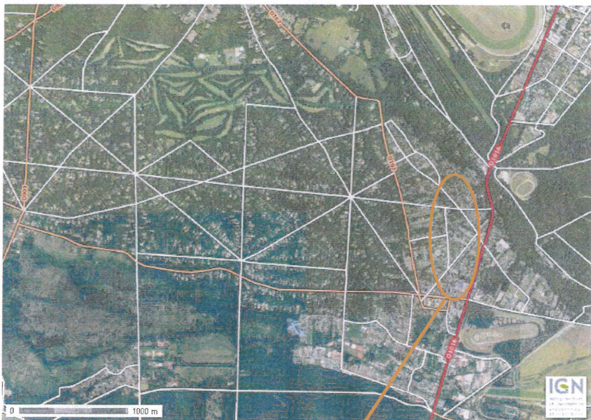
Secteur du projet

Longitude : 2° 25' 23.1" E Latitude : 49° 09' 44.1" N