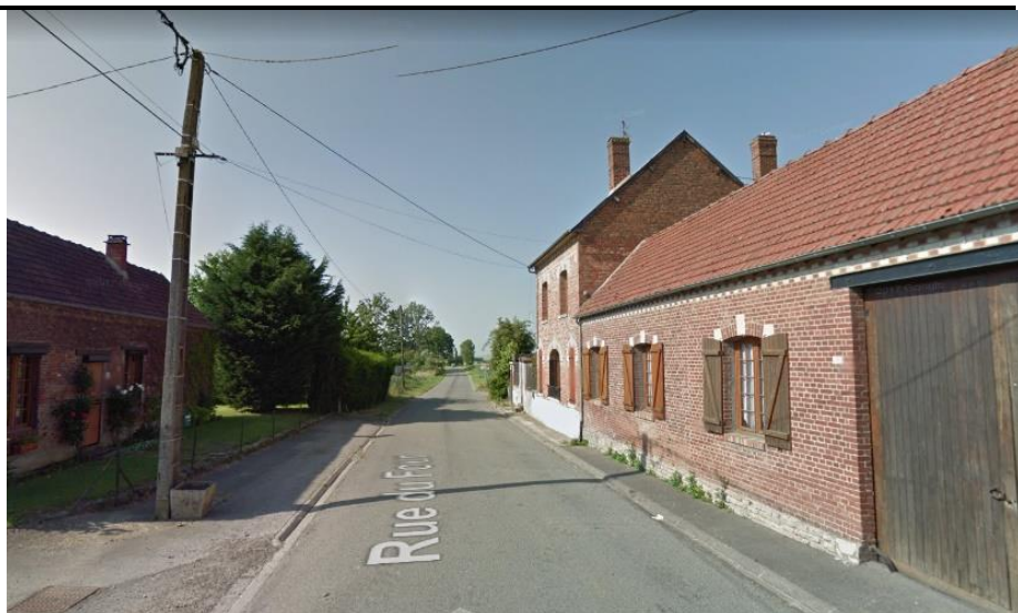
Sortie de Rollot vers Courcelles-Epayelles dans la rue du Four.

12 : Les mesures effectuées par le bureau d'étude Planète Verte pour les chiroptères s'appuient sur 12 points d'écoute répartis sur la Zone d'Implantation Potentielle (ZIP), un déplacement lent le long des éléments structurant du paysage, un point d'écoute fixe sur une nuit complète et une écoute en ballon à 80m d'altitude. Ce protocole est en conformité avec les recommandations du guide du MEDD sur les études d'impacts des parcs éoliens terrestre. Toutes ces prospections permettent de garantir qu'une espèce fréquentant le site sera automatiquement détectée, repérée et identifiée. Effectivement, l'étude bibliographique recense le grand et petit rhinolophe à proximité du secteur d'étude. Cependant, aucun contact de cette espèce n'a été recensé pendant les différentes sorties de terrain. Je redirige le demandeur à l'expertise paysagère page 188 à 193 pour la méthodologie et page 143 à 162 pour les résultats des impacts et effets cumulés.